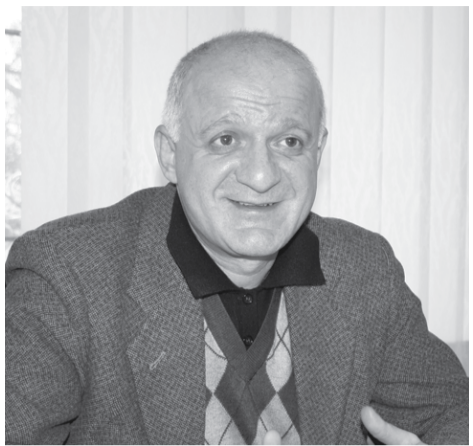
ბიუჯეტში ტრადიციულად პრიორიტეტულია, ასევე, სტუდენტური ღონისძიებების

დამტკიცდება, უკვე თამამად შეგვეძლება ვისაუბროთ მის პრიორიტეტებსა და ხარჯვით ნაწილზე. ამ ეტაპზე მხოლოდ იმის თქმა შეგვიძლია, რომ ჩვენი მწირი რესურსების პირობებში შესაძლებლობა მოგვეცა 10-20 პროცენტის ფარგლებში გაგვეზარდა აკადემიური და ადმინისტრაციული პერსონალის ხელფასები.