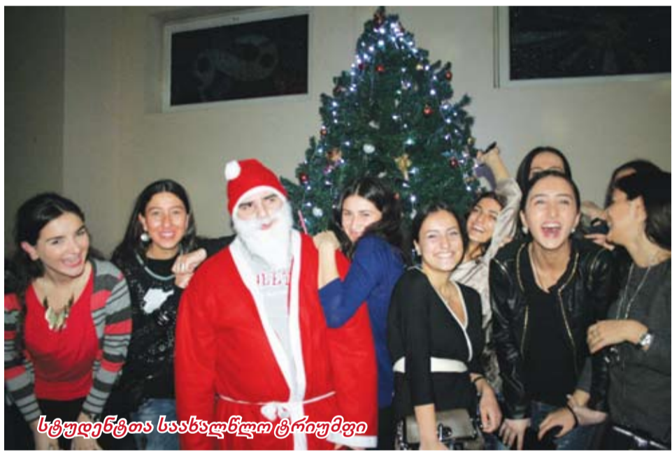
სტუდენტთა სახალწლო ტრეზინგი

ვისურვებდი, 2012 წელი სიმშვიდის წელი ყოფილიყო. მინდა იყო სიწყნარა — არა „დაჭაობაბული“ სიწყნარა, არამედ მშვიდობა და გვდგომოდეს. ქვეყნისთვის წინსვლის და წარმატების წელი ყოფილიყო! საქართველოს მომავალი არის განათლება — უფრო მეტი განათლება ული ადამიანი, უფრო მეტი პრაქტიკული ცოდნის მქონე პირი უნდა, ამიტომ დიდი სურვილი მაქვს, სწორი მიმართულებით სვლა განვაგრძოთ. მსურს, მომავალი წელი ხედვით და ჯანმრთელობის მომავალი იყოს. როდესაც ჩემს თავს 2000 წლის შემდეგ წარმოვიდგინდი, ვეგონა, ქალიან მოხუცებული ვიქნებოდი და ცხოვრების ინტერესი დაკარგული მქნებოდა, თუმცა, ეს წლები არაფერი ყოფილა... ჯერ კიდევ ყველაფერი წინ გვაქვს! 2012 წელს მინდა, წარმატებები ვუსურვო ჩვენს აზიურ ინტელექტს და კურსდამთავრებულებს. ამ თაობაზე ქალიან გვერია დამოკიდებული — ქვეყნის მომავალი მათი უნდა იყოს... ყველას ვულოცავ დამდეგ ახალ წელს!