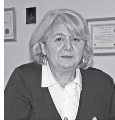
ახალ წელს იმედი ყოველთვის მოაქვს და ვფიქრობ, რომ მომავალი წელი იქნება უკეთესი, ვიდრე წინა წელი იყო.

ყველაზე კარგ სურვილებში სწორედ ასეთი საქართველო მინატრია.