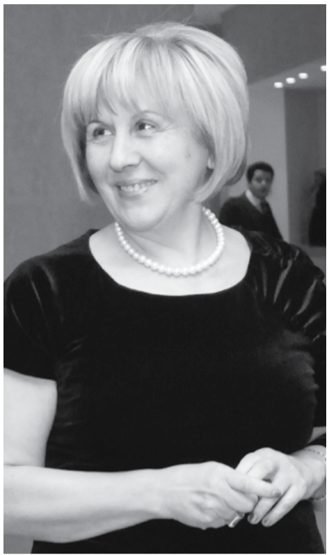
მათ თავად მოისურვეს, ჩამოსულიყვნენ და ამ მოძრაობაში რაღაც ფორმით მიეღოთ მონაწილეობა.

ჩვენმა ამ ძალისხმევამ შედეგი გამოიღო. უკვე დაგროვდა ქართული ანსამბლები და