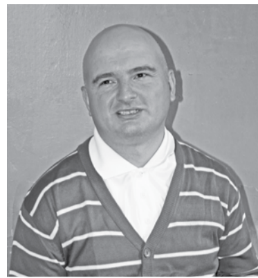
ფორმები წარმატებით გაგრძელდეს და, შედეგად, საქართველოს გაძლიერება მოიტანოს!

მინდა, ახალი წელი მიეფულოცო საქართველოს და თბილისის სახელმწიფო უნივერსიტეტს. მინდა ვისურვო, რომ დაწყებული რე-