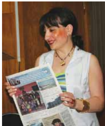
მცდელობა ადამიანების სიტყვით განაპურებისა