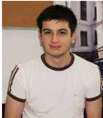
საზოგადოებრივ თემაზეც უკვე ვფიქრობ

პროექტი „Summer Job“ 20 აგვისტოს დასრულდება.