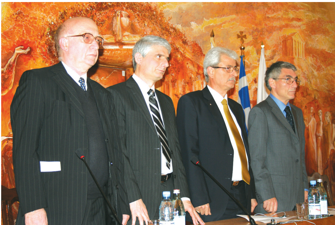
საბერძნეთი თითქმის ორი საუკუნეა ეროვნულ დღესასწაულს 25 მარტს აღნიშნავს. ამ დღეს ბერძენებმა საერთო ელინური აჯანყება წამოიწყეს, მრავალწლიანი ბრძოლის შედეგად ოსმალური უღელი მოიშორეს და ევროპას საბოლოოდ დაუკავშირდნენ.