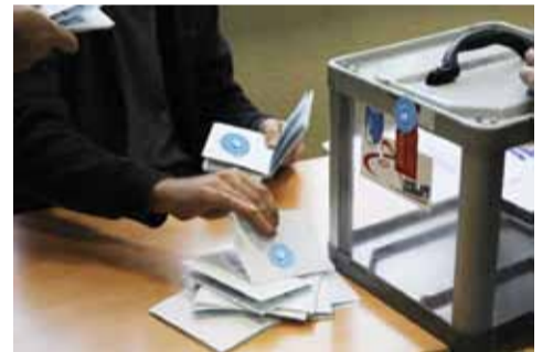
გაბრეჟია მ-3 გვ.

თუმცა, მეორე დღესვე დაიწყო მუშაობა ჩვენს წესდებაში შესაგან ცვლილებათა მთელ პაკეტზე, რომელთა შორის ერთ-ერთი მნიშვნე-