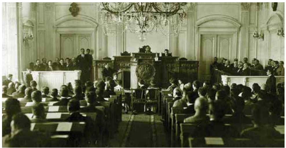
დაფუძნებული კრების სხდომა. 1919 წელი.

თბილისის სახელმწიფო უნივერსიტეტის ბიბლიოთეკაში 1918-1921 წლების ენციკლოპედიამ შემუშავდა დაიწყო. ენციკლოპედია იქნება მოცულობითი ფუნდამენტური ნაშრომი, რომელშიც რეალობაზე მეტი სტატია შევა.