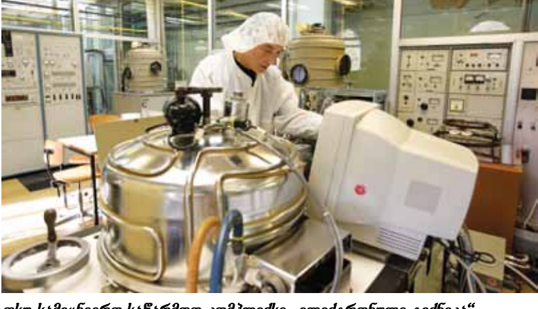
თსუ სამეცნიერო-საწარმოო კომპლექსი „ელექტრონიკის გეკნიკა“