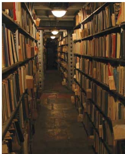
თსუ ეროვნული სამეცნიერო ბიბლიოთეკის საცავებში