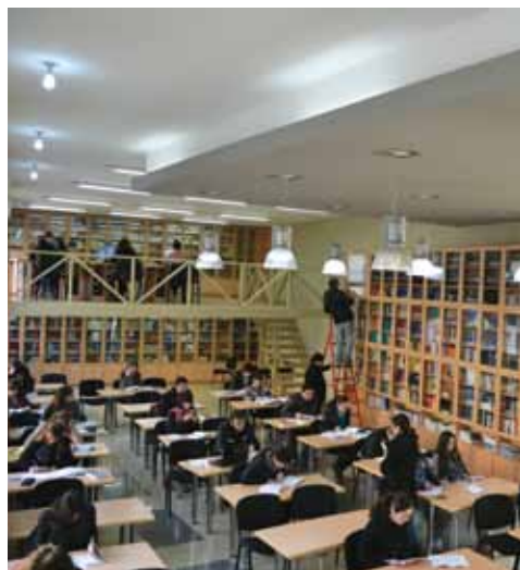
თსუ იურიდიული ფაკულტეტის ბიბლიოთეკა