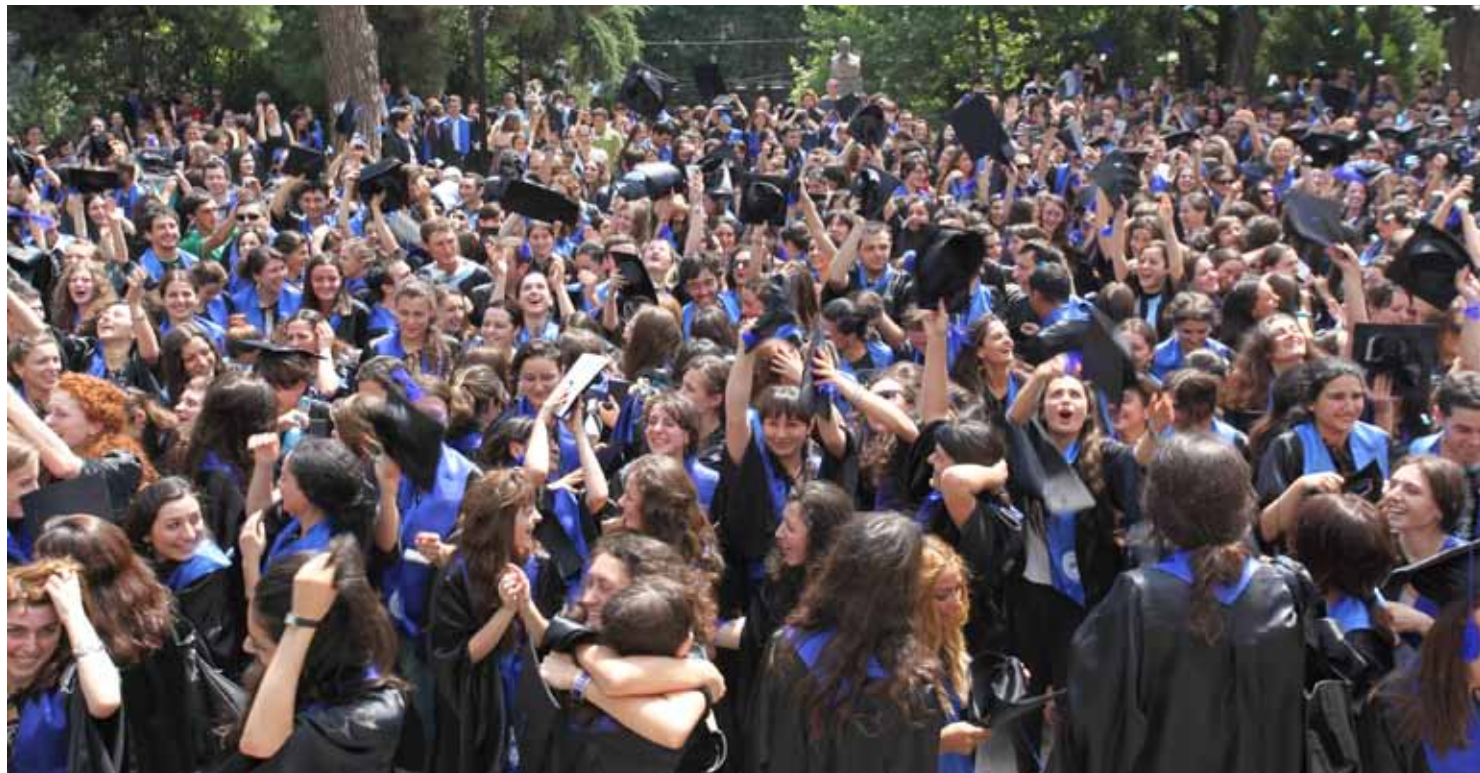
2011 წელს ივანე ჯავახიშვილის სახელობის თბილისის სახელმწიფო უნივერსიტეტი 2560-მა ბაკალავრმა დაამთავრა. 2012 წელს 2400 სტუდენტი ემზადება თსუ-ის ბაკალავრის ხარისხის მოსაპოვებლად. 2012 წელს თსუ 4550 პირველკურსელს ელოდება.