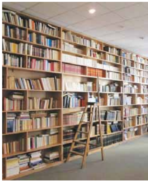
თსუ კლასიკური ფილოლოგიის ნეოგურჯისტის ბიბლიოთეკა

ივანე ჯავახიშვილის სახელობის თბილისის სახელმწიფო უნივერსიტეტის ბიბლიოთეკაში მკითხველს ბევრი ისეთი წიგნის მოძიება შეუძლია, რომელიც სხვაგან არსად, არც ერთ ქართულ ბიბლიოთეკაში არ მოიპოვება. ამას თავისი საფუძველი აქვს - თსუ-ის ბიბლიოთეკის შექმნის ისტორია პირველი ქართული უნივერსიტეტის ოფიციალურად დაარსებამდე თითქმის თვეწახვერით ადრე, 1917 წლის 19 დეკემბერს, ქართველი პუბლიცისტის კიკა აბაშიძის ანდერძის საფუძველზე გაღმოსული წიგნებით დაიწყო.