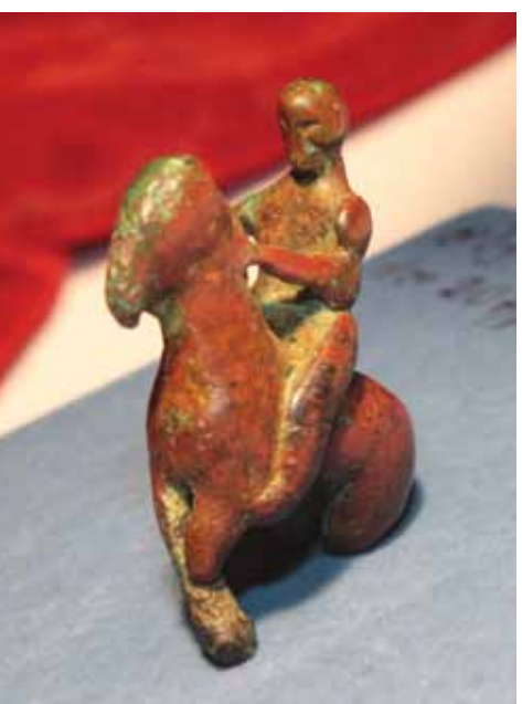
ბრინჯაოს ქანდაკება. აწყური. ძვ.წ. IV ს. თსუ მუზეუმის ექსპონატი