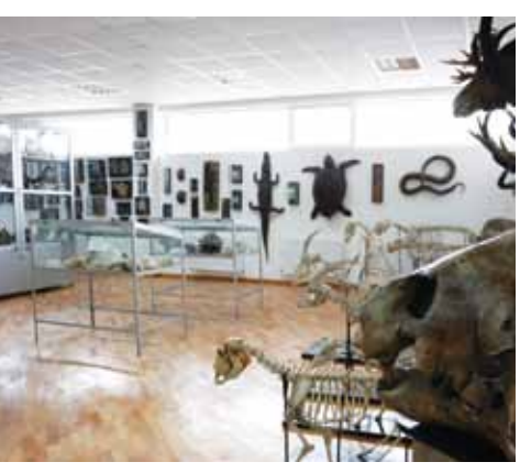
თსუ მინერალოგიის მუზეუმი