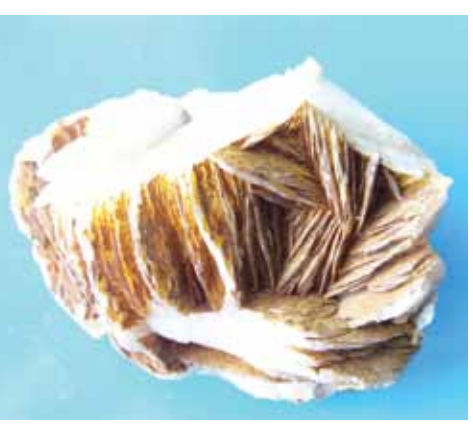
ექსპონატი თსუ მუზეუმის მინერალოგიის ფონდიდან