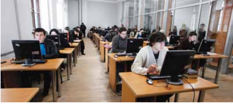
რესურსცენტრი თსუ II კორპუსში