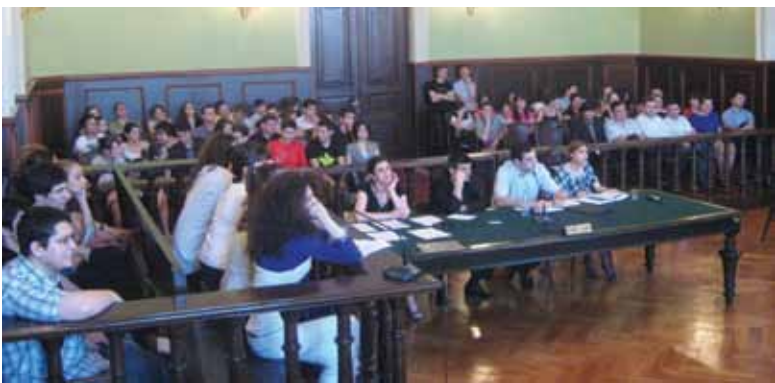
თსუ სტუდენტები იმიტირებულ სასამართლო პროცესზე

გუსტ და საბუნებისმეტყველო მეცნიერებები აქვთ მხარდაჭერა სახელმწიფოს მხრიდან და ფაკულტეტის პოპულარობაც აბიტიურენტებში ყოველწლიურად იზრდება. მემოთ აღნიშნული მიზეზების გამო 2011 წელს ფაკულტეტზე ჩარიცხულნი 800 სტუდენტიდან სახელმწიფო დაფინანსება 97%-მა მოიპოვა. ვფიქრობთ, რომ 2012 წელს ერთიანი ეროვნული გამოცდების შედეგად ფაკულტეტზე ჩარიცხულ სტუდენტთა დიდი ნაწილი მიიღებს სახელმწიფო დაფინანსებას. 2012 წელს გუსტ და საბუნებისმეტყველო მეცნიერებათა