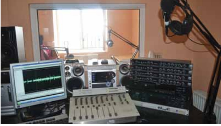
სოციალურ და პოლიტიკურ მეცნიერებათა ფაკულტეტი, რადიო სტუდია