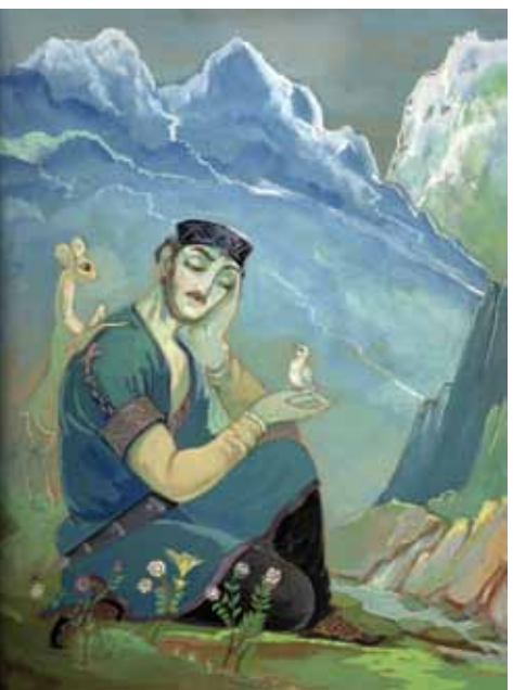
ლალო გუდიაშვილი - „მინდია“. თსუ მუზეუმის ექსპონატი

მუზეუმისთვის ახალი სიცოცხლის შთაბერვის პროცესი უნივერსიტეტის პირველ კორპუსთან არის დაკავშირებული. უახლოეს პერიოდში მნახველებს თსუ-ის მუზეუმის ექსპონატების ნახვა თსუ-ის პირველი კორპუსის განახლებულ სივრცეში შეეძლება.