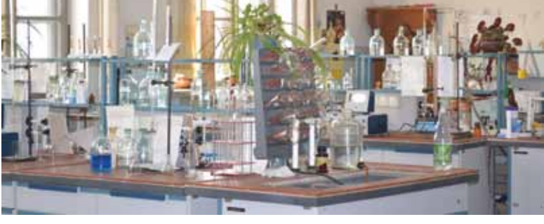
ქიმიის სასწავლო ლაბორატორია