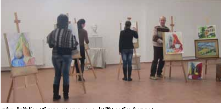
თსუ პუმანიგარული ფაკულტეტი, სამხატვრო სტუდია