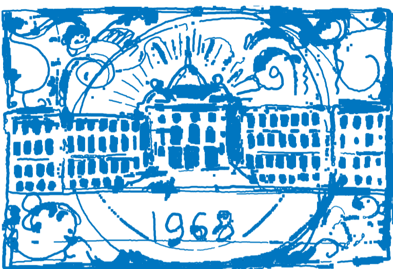
მლის წასაკითხად რიგში ვდგებოდი. უნივერსიტეტს უკავშირდება ჩვენი პირველი ემპაკობებიც, წაჭეიფება, გოგონებთან სეირნობა“.

როგორც უფროსი თაობის მწერალი იხსენებს, მას და მის თაობას უნივერსიტეტი ლეგენდად, მითოსად ქცეული ჰქონდათ: „ასეთი დამოკიდებულება გვექონდა იმ მასწავლებლების გამო (მთელ პროფესურას არ ვგულისხმობ), რომლებზეც გვასწავლიდნენ. უნივერსიტეტში შეეხვედი კორნელი კეკელიძეს, აქ მოდიდა მალვა ნუცუბიძე და კიდევ უამრავი ლეგენდა... აქ ვკითხულობდი აკრძალულ ლიტერატურას, რო-