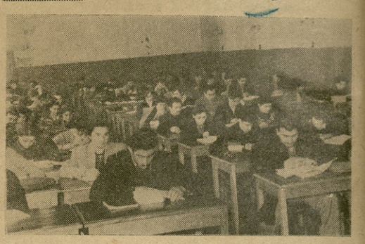
სწავთბ. უნივერსიტეტის I კორპუსის სტუდენტთა სამკითხველოს დარ-ბაზი გამოცდების პერიოდში.